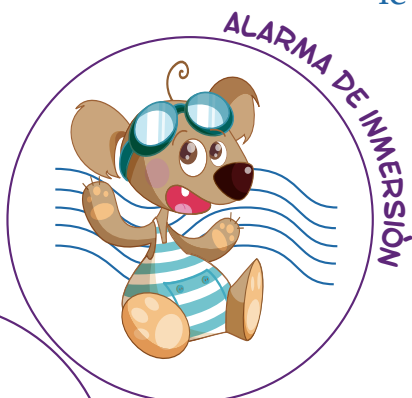
ALARMA DE INMERSIÓN

Si su hijo se aleja a más de 30 metros de Ud