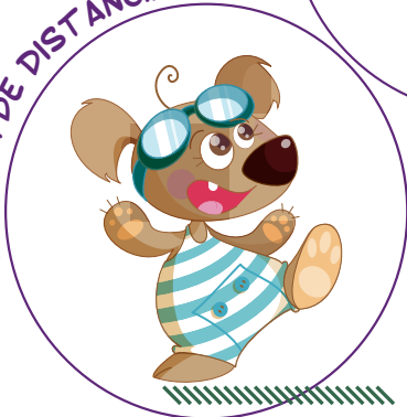
ALARMA DE DISTANCIA

El Securyploof a sido especialmente estudiado para ser utilizado en todas las situaciones, sea en agua salada de la playa, agua clorada de la piscina, agua sucia de un estanque, etc.